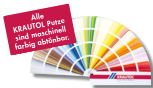
EASY RAPID FEINPUTZ