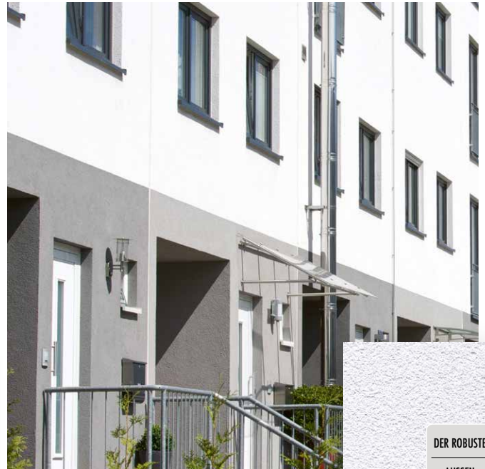
DER ROBUSTE AUSSEN